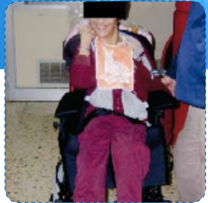
2005 - Consegna del sistema di postura raggiungimento degli obiettivi: consentita la posizione seduta e favorite la socializzazione e la comunicazione