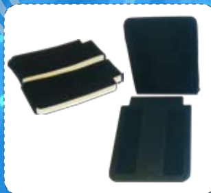
Sedili, Schienali e Imbottiture