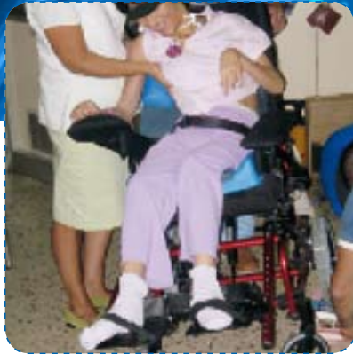
2005 - Prove su simulatore di seduta