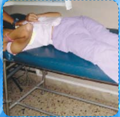
2005 - Analisi del paziente in posizione supina e valutazione articolare