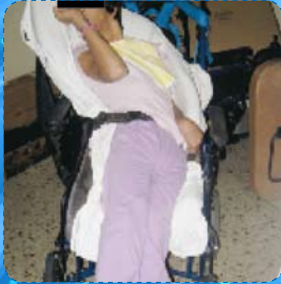
2005 - Analisi del paziente da seduto sull'ausilio in uso