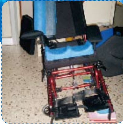
vista dell'assetamento del simulatore con prova di basculamento laterale sx