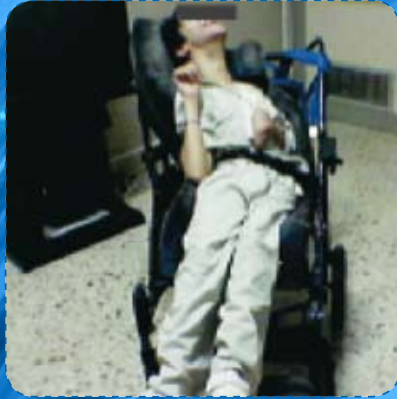
2001 - Analisi del paziente da seduto sull'ausilio in uso

Paziente di anni 33, in tetraparesi da PCI, forte tono estensorio, difficoltà alla posizione seduta, impedita comunicazione e socializzazione.